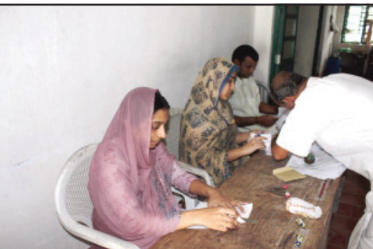
നാഷണൽ പോപ്പുലേഷൻ റജിസ്ട്രേഷൻ ഭാഗമായി കവരത്തിയിൽ നടന്ന വ്യക്തികളുടെ ഫോട്ടോഗ്രാഫ് ശേഖരണത്തിൽ നിന്നുള്ള ഒരു ദൃശ്യം.