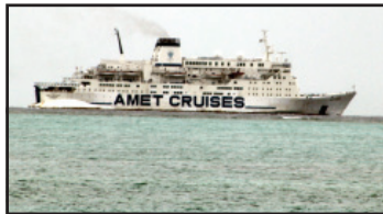
വിനോദസഞ്ചാരികളുമായി എം.വി. അമിറ്റ് മെജസ്റ്റി എന്ന യാത്രാക്കപ്പൽ.