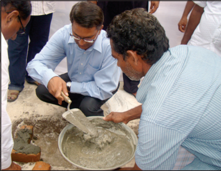
ബിത്ര ദ്വീപിലെ ഫസ്റ്റ് - എയ്ഡ് സെന്ററിന്റെ വിപുലീകരണത്തിനുവേണ്ടിയുള്ള കെട്ടിടത്തിന്റെ ശിലാസ്ഥാപന കർമ്മത്തിനുശേഷം അഡ്മിനിസ്ട്രേറ്റർ, മുതിർന്ന ഉദ്യോഗസ്ഥർ, പഞ്ചായത്ത് പ്രതിനിധികൾ എന്നിവരോടൊപ്പം.