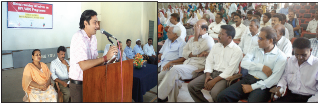
Shri. Anoop Thakur, Deputy Collector inaugurating the three day training programme.