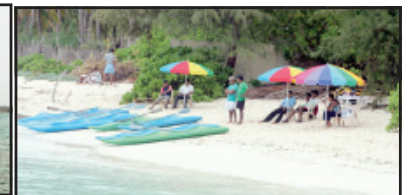
കടമത്ത് ദ്വീപിന്റെ മനോഹരമായ ആസ്വാദനത്തിന് വിനോദസഞ്ചാരികൾ.