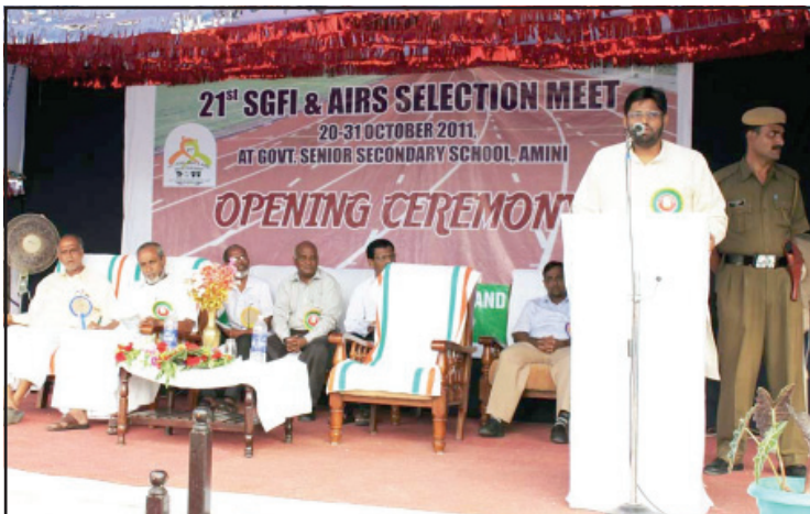
Adv. Hamdullah Sayeed, Member of Parliament delivering inaugural address in the SGFI and AIRS Selection Meet at Amini.