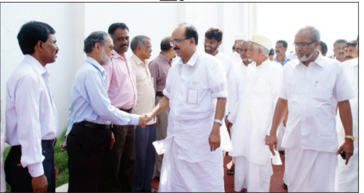
കേന്ദ്ര ഉപഭോക്തൃ കാര്യ ഭക്ഷ്യ പൊതുവിതരണ വകുപ്പ് മന്ത്രി കെ.വി. തോമസിനെ ഉദ്യോഗസ്ഥ മേധാവികൾ സ്വീകരിക്കുന്നു.