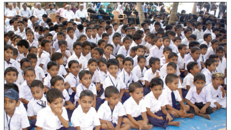
Joyful faces of School children of Chetlat Island on the occasion of Children's Day Celebration.

Thereafter attractive cultural programmes like Oppana, Mapplilla Song, and Dholi Pattu etc. were staged to make the celebration a grand success. Students and teachers from all the schools were actively participated the entire celebrations.