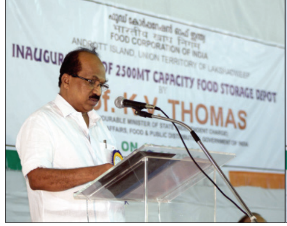
ആന്ത്രോത്തിലെ എഫ്. സി.ഐ. ഗോഡൗൺ ഉദ്ഘാടനം ചെയ്തുകൊണ്ട് കേന്ദ്ര ഉപഭോക്തൃ കാര്യ ഭക്ഷ്യ പൊതുവിതരണ വകുപ്പ് മന്ത്രി കെ.വി. തോമസ് സംസാരിക്കുന്നു.