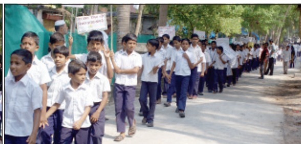
A view from the rally organised as part of the Education Day Celebration.

Chetlat : As part of the nation wide celebration of the Education Day in order to commemorate the birth anniversary of the first Education Minister of India, Moulana Abdul Kalam Azad, the founder of modern education system and a great educationalist celebrated at Govt.Senior Secondary School on 11 th November, 2011.