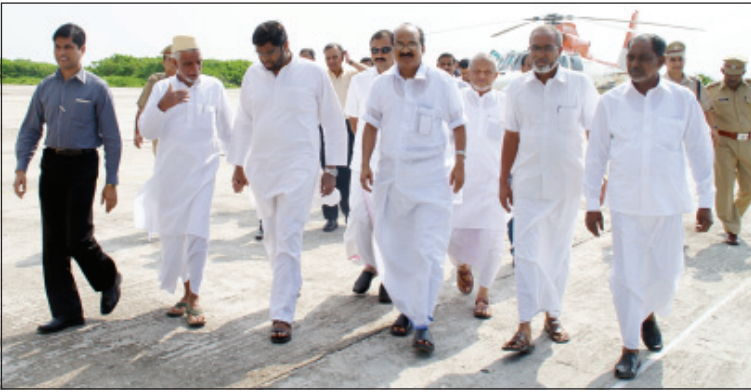
കവരത്തി ഹെലിപാഡിലെത്തിയ കേന്ദ്ര ഉപഭോക്തൃ കാര്യ ഭക്ഷ്യ പൊതുവിതരണ വകുപ്പ് മന്ത്രി കെ.വി. തോമസിനെ സ്വീകരിക്കുന്ന ഉദ്യോഗസ്ഥരും പഞ്ചായത്ത് പ്രതിനിധികളും.