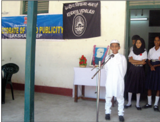
Children's Prime Minister addresses in the Special Assembly held at Kendriya Vidyalaya, Kavaratti.