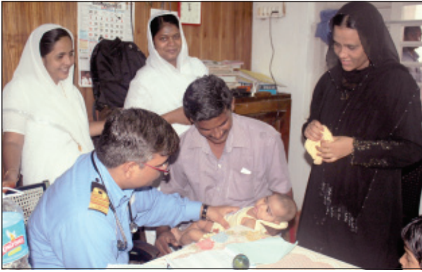
സുപ്പർ സ്പെഷ്യാലിറ്റി മെഡിക്കൽ ക്യാമ്പിൽ ഡോക്ടർമാർ രോഗികളെ പരിശോധിക്കുന്നു.