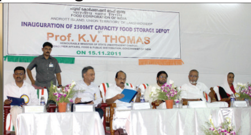
A view from the meeting conducted as part of the inaugural function of the FCI Godown at Andrott Island on 15 th November, 2011.

Andrott: The first Food Corporation of India Godown Complex in Lakshadweep was inaugurated here on 15 th November by Prof. KV Thomas, Hon'ble Minister of state (Independent Charge) for Consumer Affairs, Food and Public Distribution, Govt of India in the presence of