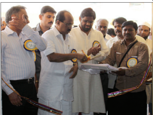
Prof. K. V. Thomas, Minister of State for Consumer Affairs, Food and Public Distribution inaugurates the FCI Godown.