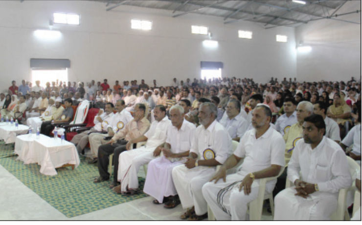
ആന്ത്രോത്തിലെ എഫ്. സി.ഐ. ഗോഡൗൺ ഉദ്ഘാടന ചടങ്ങിൽ സംബന്ധിക്കാണെത്തിയവരുടെ ഒരു ദൃശ്യം.

ആന്ത്രോത്ത് : ലക്ഷദ്വീപിലെ ആദ്യത്തെ എഫ്.സി.ഐ. ഗോഡൗൺ കേന്ദ്ര ഉപഭോക്തൃ കാര്യ, ഭക്ഷ്യ പൊതു വിതരണ മന്ത്രി പ്രൊഫസർ, കെ.വി. തോമസ് നവംബർ 15-ന് ഉദ്ഘാടനം ചെയ്തു. പാർലമെൻ്റ് അംഗം അഡ്വ. ഹംദുള്ള സയ്യാദ്, പൊതുവിതരണ